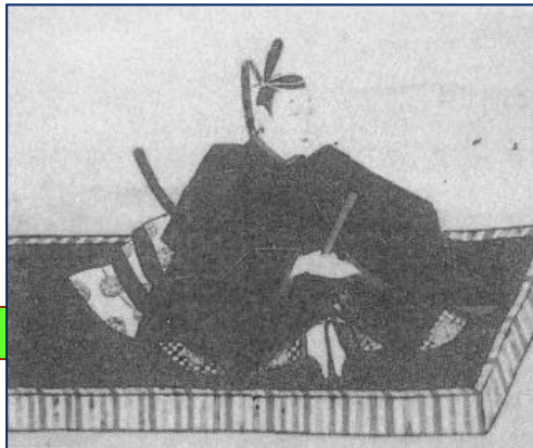
尹良親王 良王君の肖像画