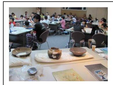
昨年度の「信長探検隊」